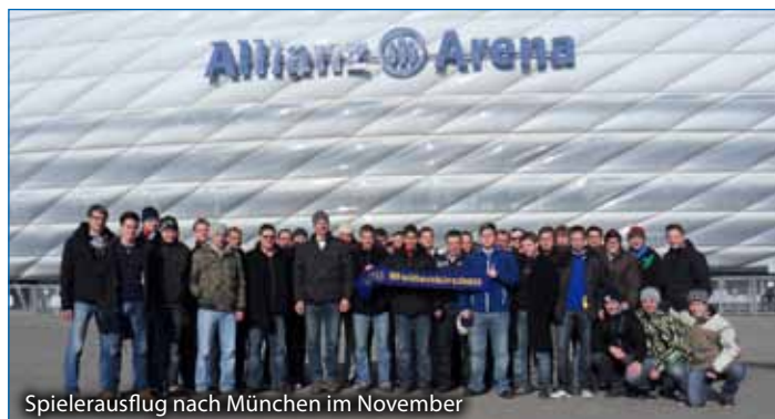
Spielerausflug nach München im November