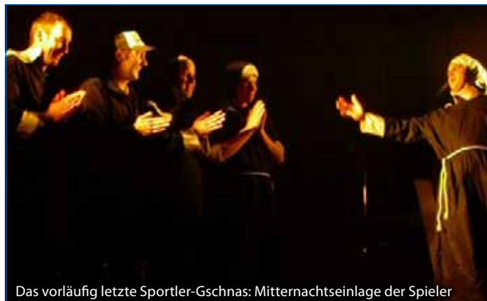
Das vorläufig letzte Sportler-Gschnas: Mitternachtseinlage der Spieler