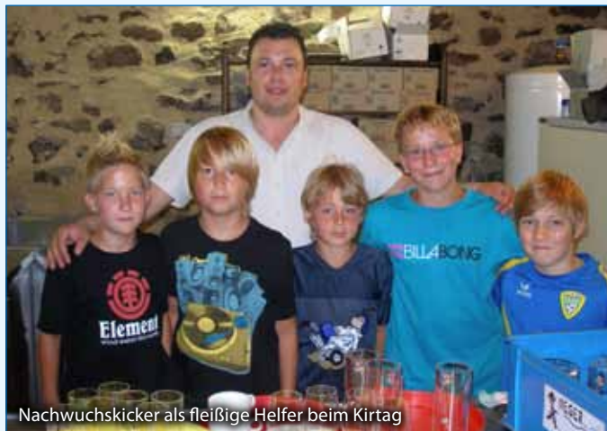
Nachwuchskicker als fleißige Helfer beim Kirtag