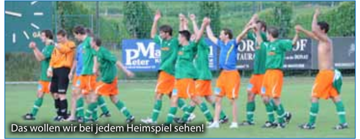
Das wollen wir bei jedem Heimspiel sehen!