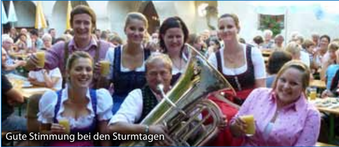
Gute Stimmung bei den Sturmtagen