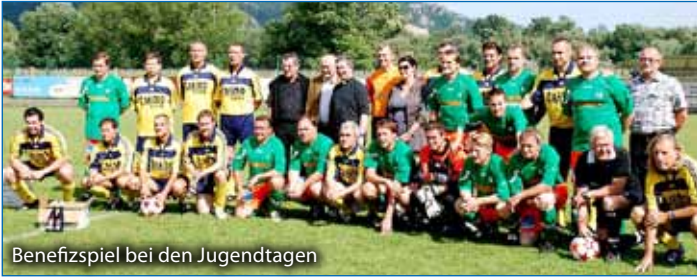
Benefizspiel bei den Jugendtagen