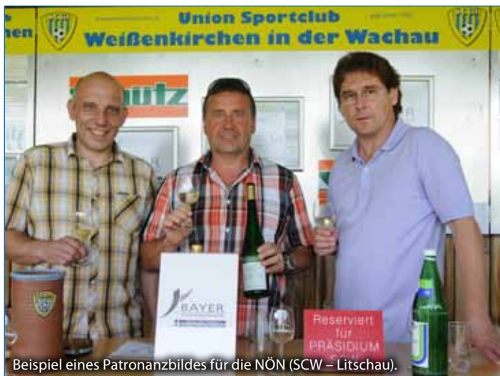
Beispiel eines Patronanzbildes für die NÖN (SCW – Litschau).

Trotz der Tatsache, dass der sportliche Erfolg mit dem Abstieg in die Gebietsliga nicht so überwältigend war, ist es gerade jetzt notwendig, gemeinsam aufzutreten. Dies ist für das Präsidium eine Selbstverständlichkeit und wird auch dementsprechend gelebt. Neben der Vergabe der Patronanzen wurde durch das Präsidium der Druck einschließlich der Gestaltung der Eintrittskarten finanziert.