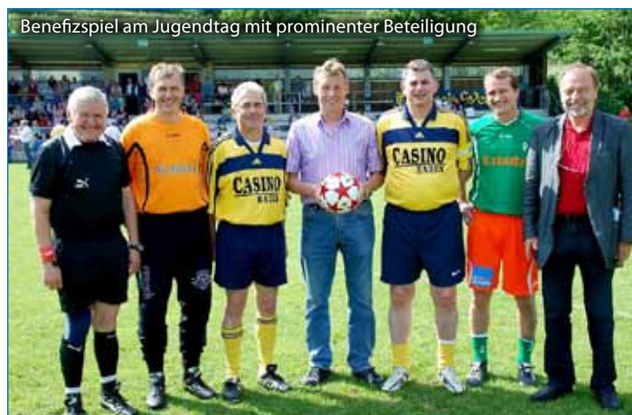
Benefizspiel am Jugendtag mit prominenter Beteiligung