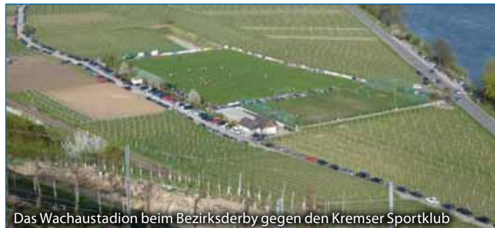
Das Wachaustadion beim Bezirksderby gegen den Kremser Sportklub